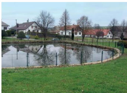
Obec Suchá – Úprava a údržba veřejného prostranství II. etapa