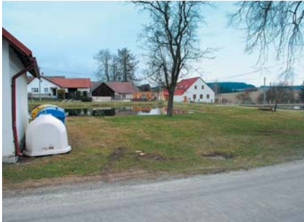
Obec Švábov – Zpevněná víceúčelová plocha