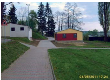
Obec Kostelec – Dokončení sportovního areálu u ZŠ Kostelec