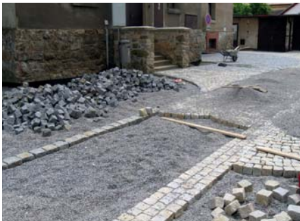
Město Třešť – Úprava nádvoří radnice v Třešti