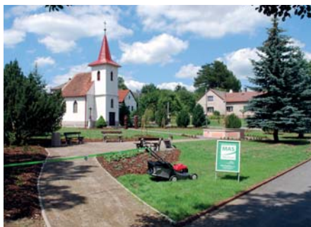
Obec Švábov – Úprava a údržba veřejného prostranství obce Švábov