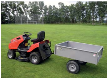
Tělovýchovná jednota Slavoj – Technické vybavení fotbalového hřiště