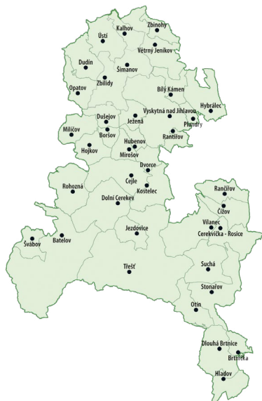
Mapa 1: Územní působnost MAS Třeštsko v roce 2022

V územní působnosti MAS Třeštsko se nachází 38 obcí. Celková rozloha území překračuje 37 tisíc hektarů. Celkem na území žilo v roce 2022 přes 20 tisíc obyvatel. V území se nachází město Třešť, městys Batelov, Dolní Cerekev, Stonařov, Větrný Jeníkov a Nový Rychnov, které tvoří přirozená centra území, a následně 32 obcí.