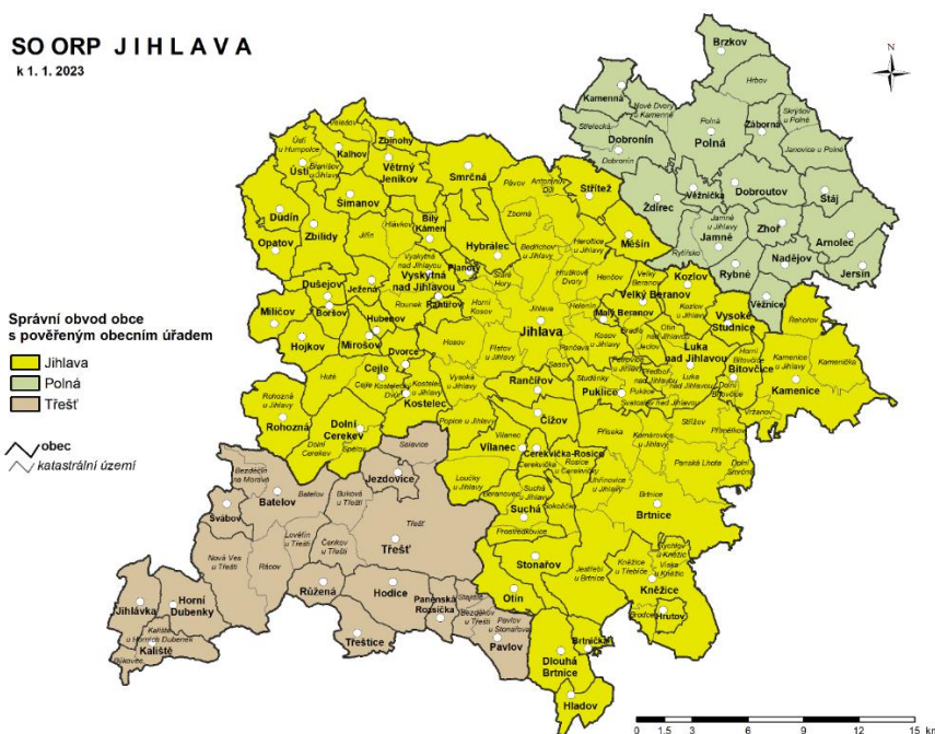
Obrázek č. 2: mapa SO ORP Jihlava k 1. 1. 2023, zdroj: ČSÚ

Správní obvod obce s rozšířenou působností Jihlava se rozkládá ve středu Kraje Vysočina v oblasti Českomoravské vrchoviny, pro níž je typická kopcovitá krajina s lesními porosty, které pokrývají přibližně třetinu území SO ORP, tři pětiny pak tvoří zemědělská půda. Území by se dalo popsat jako oblast s dominantním postavením krajského města Jihlava, v němž žije zhruba polovina obyvatel SO ORP. Ve správním obvodu ORP Jihlava bylo dle ČSÚ k 1. 1. 2023 registrováno 78 obcí, 145 částí obce a 146 katastrálních území. V SO ORP Jihlava se nachází pouze 4 obce se statutem města, konkrétně Jihlava, Polná, Třešť a Brtnice, ve kterých žijí cca 2/3 obyvatel ORP. Město Jihlava je obcí s rozšířenou působností a město Polná a Třešť jsou obcemi s pověřeným obecním úřadem. V SO ORP Jihlava je 6 městysů, a to: Batelov, Luka nad Jihlavou, Dolní Cerekev, Kamenice, Větrný Jeníkov a Stonařov. ORP Jihlava je z většiny tvořen malými obcemi do 499 obyvatel. Počet obyvatel SO ORP Jihlava dle ČSÚ k 31. 1. 2023 činil 102 996 obyvatel, z toho 51 110 mužů a 51 886 žen. Ve věku 0-14 let zde žilo 16 956 osob, 65 346 osob ve věku 15-64 let a dále 20 694 osob nad 65 let. Průměrný věk činil 42,4 let.