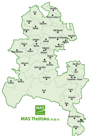
Mapa 1: Územní působnost MAS Třeštsko v roce 2025

V územní působnosti MAS Třeštsko se nachází 39 obcí. Celková rozloha území překračuje 37 tisíc hektarů. Celkem na území žilo v roce 2025 lehce přes 22 tisíc obyvatel. V území se nachází město Třešt, městys Batelov, Dolní Cerekev, Stonařov, Větrný Jeníkov a Nový Rychnov, které tvoří přirozená centra území, a následně 33 obcí.